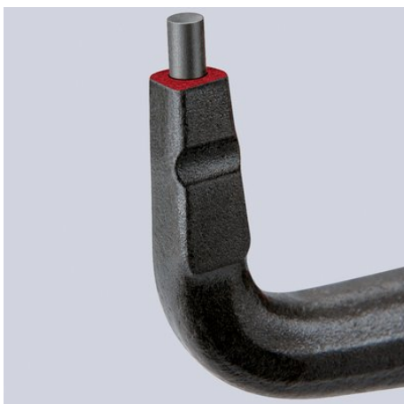
Stabile, eingesetzte Spitzen aus hochverdichtetem Federstahl

Technische Änderungen und Irrtümer vorbehalten