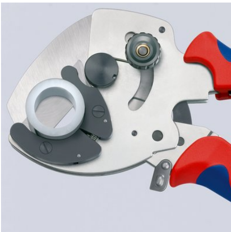
Sauberer Schnitt dickwandiger Kunststoff- und Verbundrohre

Technische Änderungen und Irrtümer vorbehalten