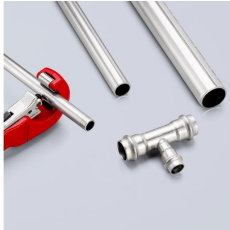
Schneller im Arbeitsalltag: Dank QuickLock-Einhandschnellfixierung rutscht das Schneidrad mit einem einzigen Daumendruck an jeden Rohrdurchmesser heran