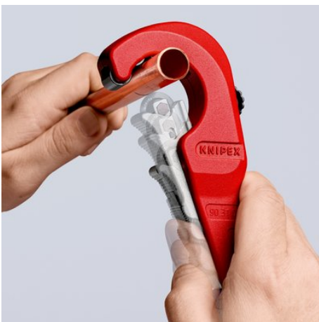
Die neue Leichtigkeit des Schneidens: geöffneten KNIPEX TubiX® Rohrschneider ansetzen ...