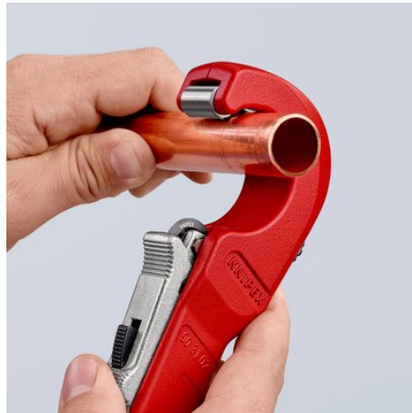
Die neue Leichtigkeit des Schneidens: geöffneten KNIPEX TubiX® Rohrschneider ansetzen ...