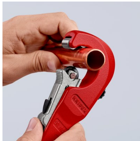
Schneidrad mit QuickLock-Einhandschnellfixierung ans Rohr schieben: schnelle Einstellung an unterschiedliche Rohrdurchmesser ...