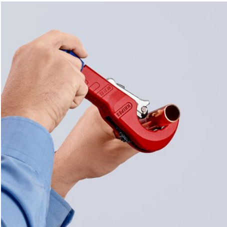
Durch Drehung schneiden und dabei mit dem ergonomischen blauen Drehknopf nachstellen ...