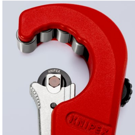
Das nadelgelagerte und abgedeferte Schneidrad aus hochwertigem Kugellagerstahl ist leicht wechselbar