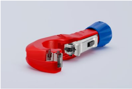
Das Schneidrad und die vier Führungsrollen laufen dank hochwertiger Nadellager beim Schneiden praktisch ohne störende Reibung – schneidet Edelstahlrohre besonders leicht