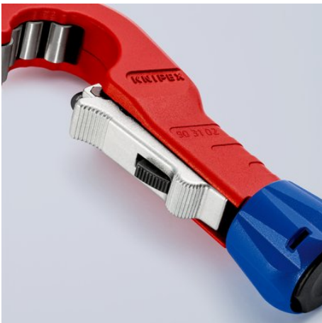
Durch die Einhandschnellfixierung kann das abgedeferte Schneidrad an den Durchmesser des Rohres herangeschoben und fixiert werden