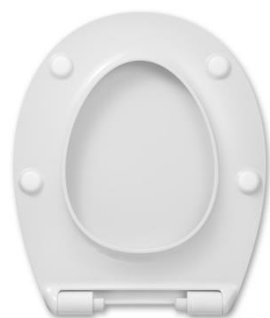
2 Deckelpuffer DPV5 4 Sitzpuffer SPV8