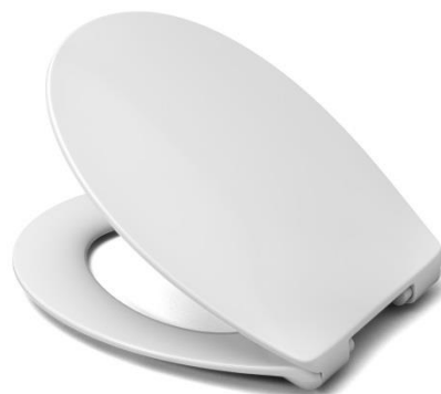
Öffnungswinkel max. 110°