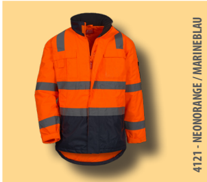
4121 - NEONORANGE / MARINEBLAU