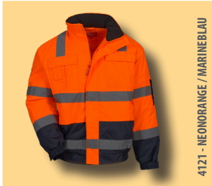
4121 - NEONORANGE / MARINEBLAU