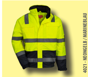
4021 - NEONGELB / MARINEBLAU